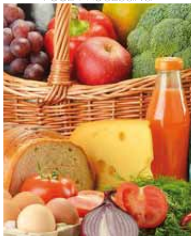
ALIMENTARE/ FOOD PROCESSING