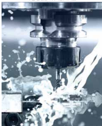
MACCHINE UTENSILI TOOLS MACHINE