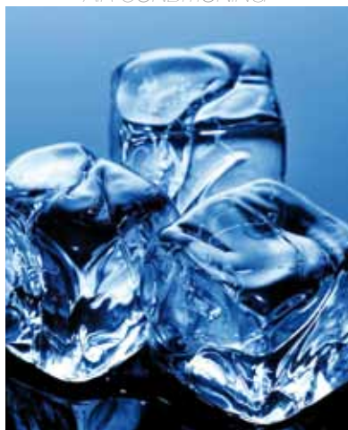
CONDIZIONAMENTO AIR CONDITIONING